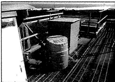
Fotografía 1: Instalación Equipo Automático