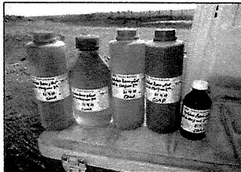
Fotografía 2: Set de Batería